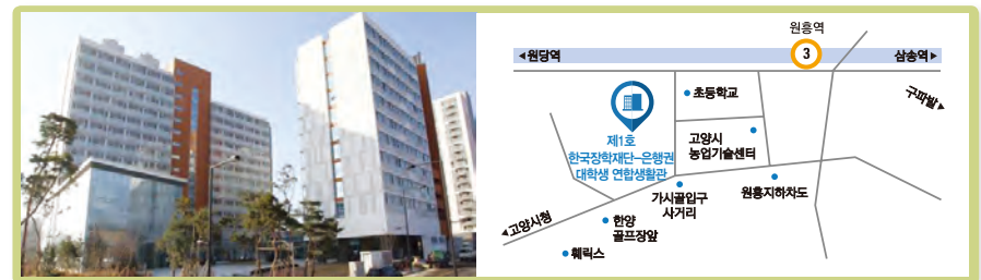
▲ 제1호 한국장학재단-은행권 대학생 연합생활관